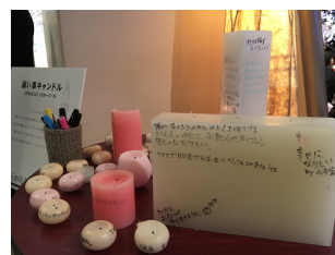
願い事を書いていただくキャンドルをロビーに設置 7/3（月）～7/7（金）