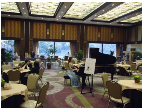
ピアノ生演奏の様子