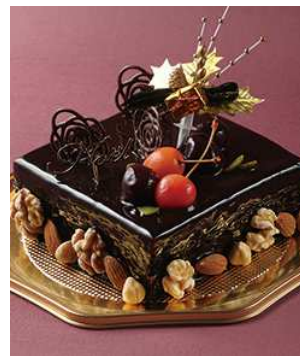
スリーズショコラノエル 限定50個 ¥4,500