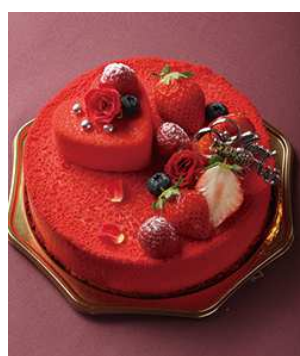
ベリークリスマス 限定50個 ¥4,500