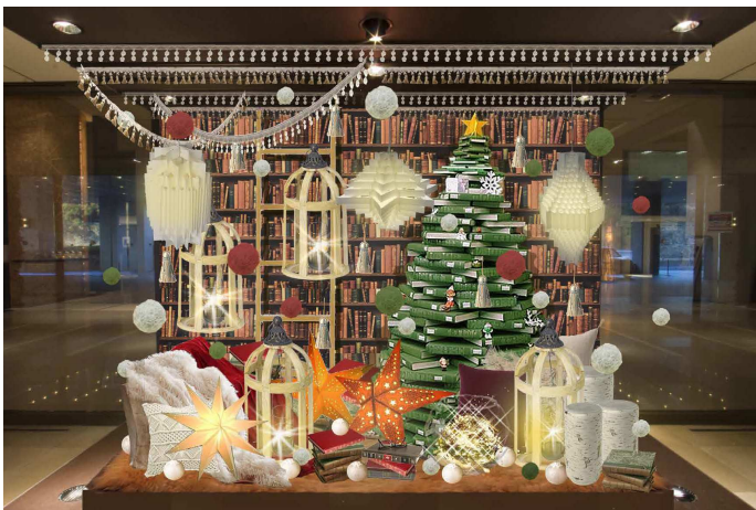
〈ホテル入口風除室〉

あたたかい灯りのランプをメインに、自然素材を用いてナチュラルでホームパーティーのような楽しい空間を演出します。