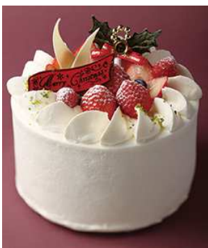
ホワイトクリスマス ¥4,600