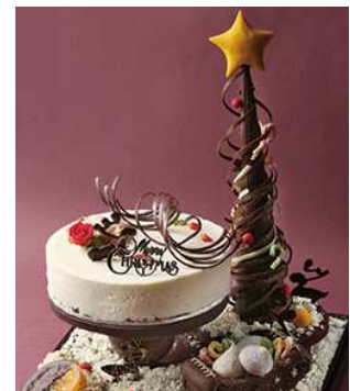
スイートクリスマス 限定10個 ¥30,000