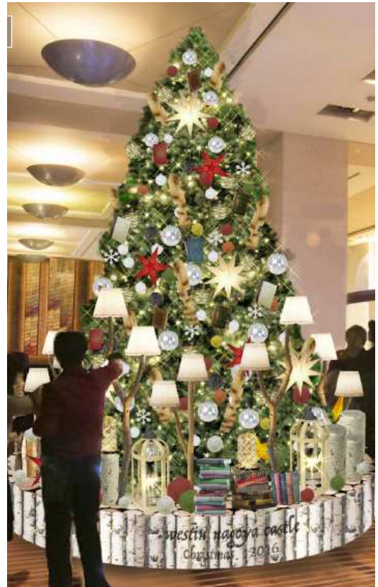
〈1Fロビー メインツリー〉

あたたかい灯りのランプをメインに、自然素材を用いてナチュラルでホームパーティーのような楽しい空間を演出します。