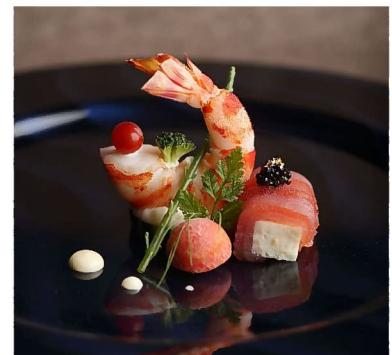
「クラウン」名古屋城を見立てた前菜