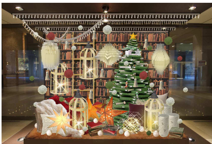
〈ホテル入口風除室〉

あたたかい灯りのランプをメインに、自然素材を用いてナチュラルでホームパーティーのような楽しい空間を演出します。