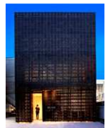
郷さくら美術館東京

2006年福島県郡山市に現代日本画の専門美術館として開館。その後、2012年東京の中目黒に東京館をオープン。昭和生まれの日本画家による50号以上の大作を中心に収蔵・展示。また東京館では、館名にちなみ、一年を通じて満開の桜を楽しんで頂くために、桜の常設展示室を設けている。