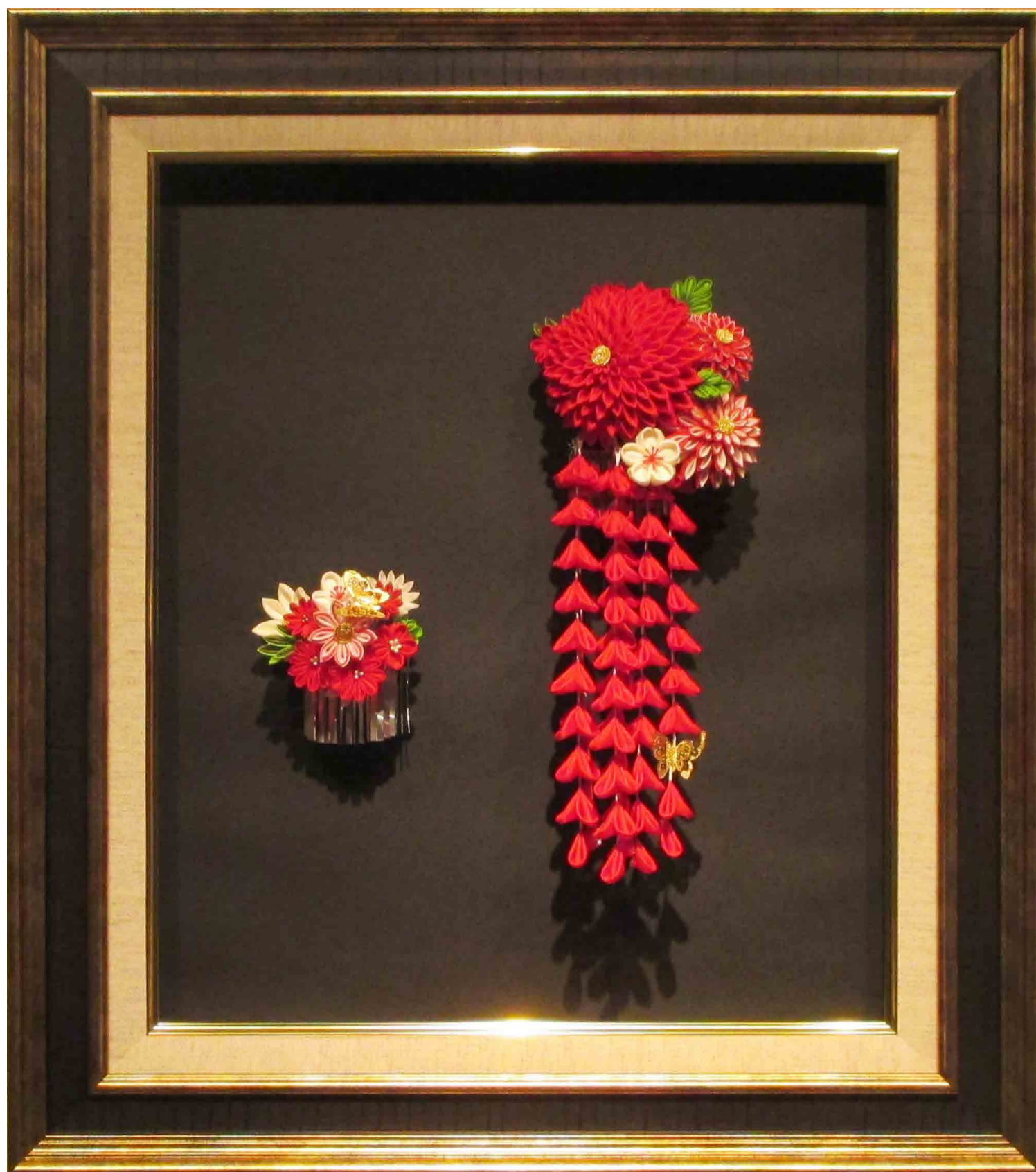
「生命」 グランディング大地に足をつけて