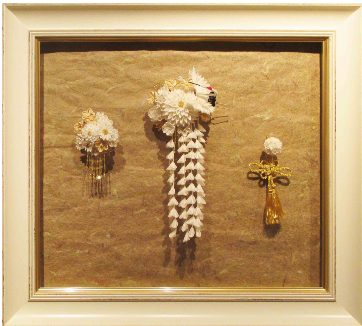
「ステージ」 新しいステージに色を変える