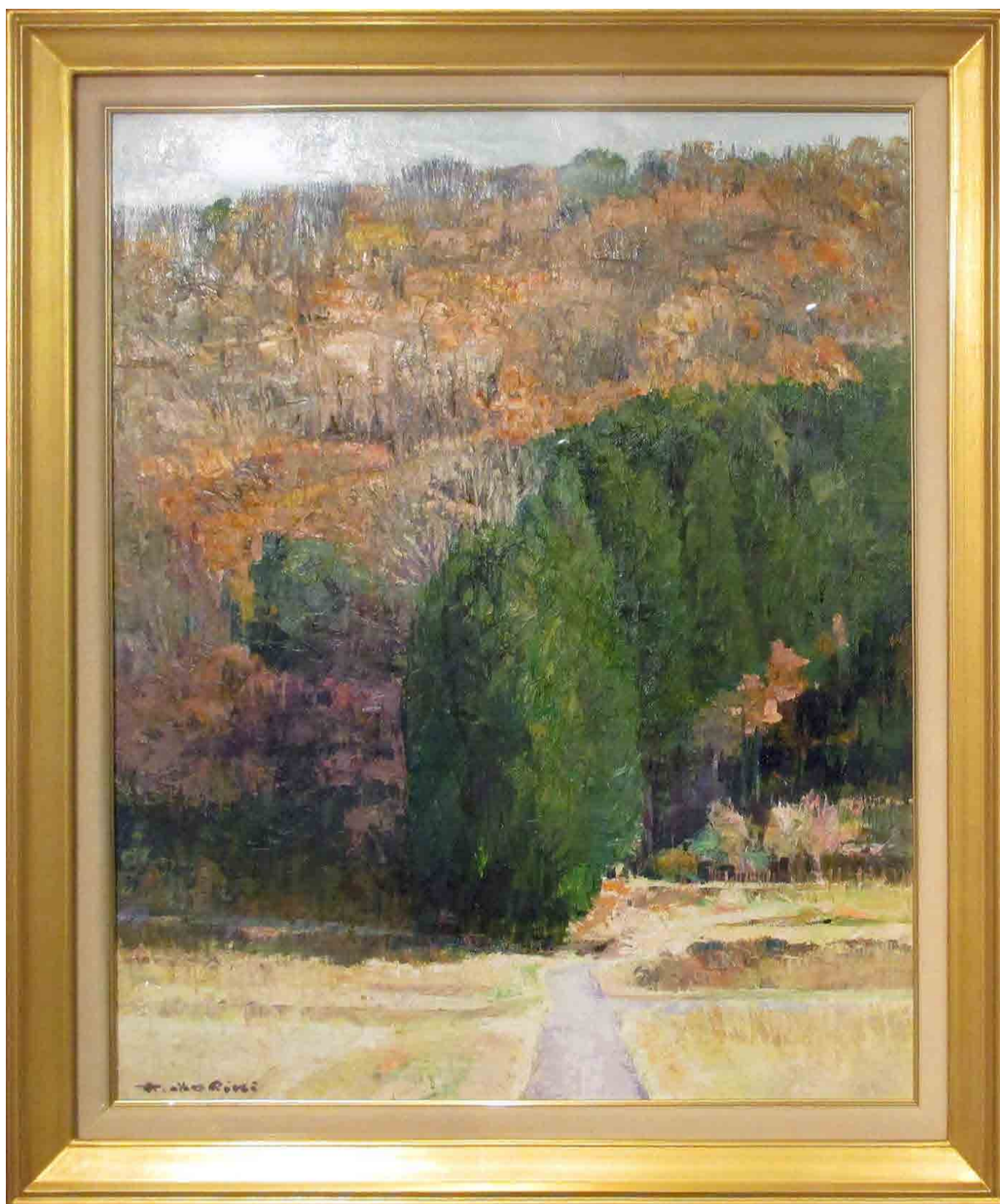
晩秋の古瀬間風景 F20